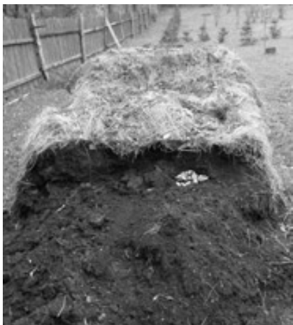
Snůška užovky stromové v hromadě kompostu