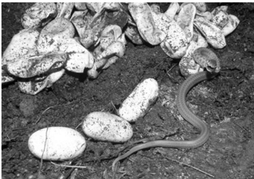
Čerstvě vylíhnuté mládě a zbytky vaječných slupek

že není okrajovým výběžkem souvislého areálu, nýbrž populací izolovanou, od něj vzdálenou přibližně dvě stě kilometrů. Ztráta přirozeného prostředí a zmenšování areálu donutily užovky stromové v Pooohří přijmout výhradně synantropní způsob života. (V Bílých Karpatech žijí většinou v přírodních biotopech, v Podyjí se vyskytují zhruba stejným dílem jak ve volné přírodě, tak v těsné blízkosti lidských sídel, mnohdy však již opuštěných). Dalším specifickým znakem populace užovek stromových v Pooohří je tamní tradiční všeobecné povědomí o existenci vzácného hada a kladný vztah k němu, který nevymizel ani po odsunu původních obyvatel Pooohří po druhé světové válce.