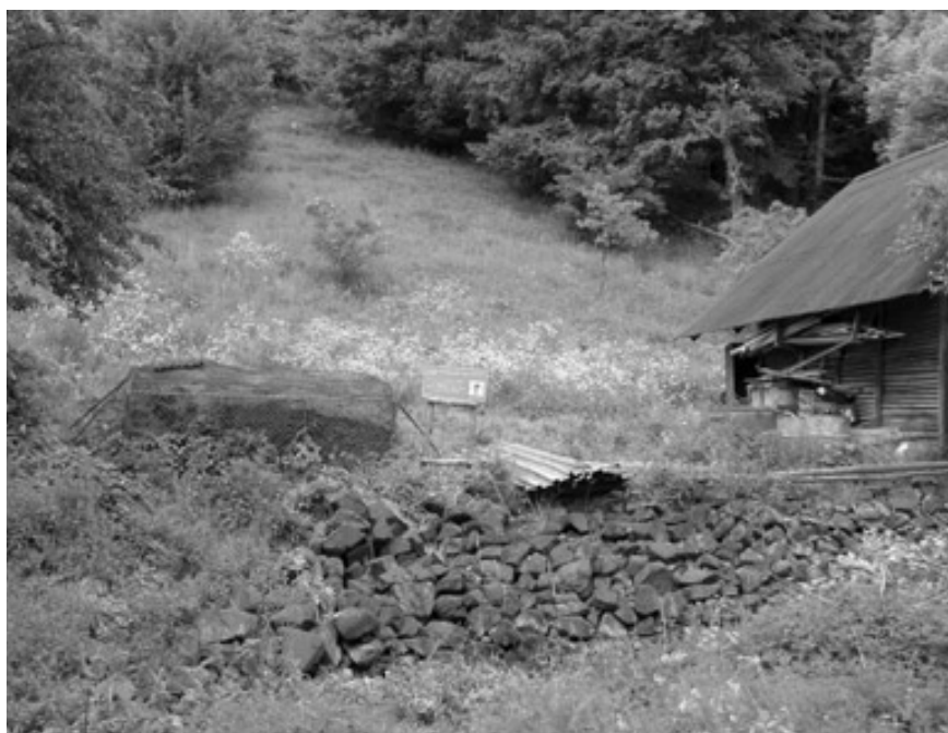
Kamenný snos, oblíbený biotop užovek stromových. V pozadí oplacené líhniště

Všechny fotografie pro tuto přílohu zhotovil Karel Janoušek