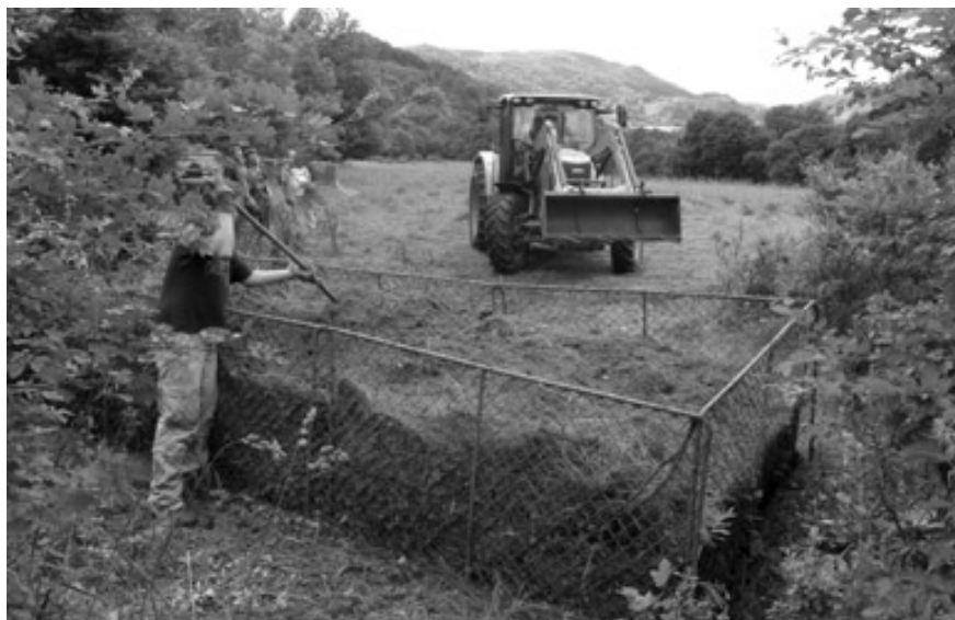
Budování líhniště pro užovky stromové