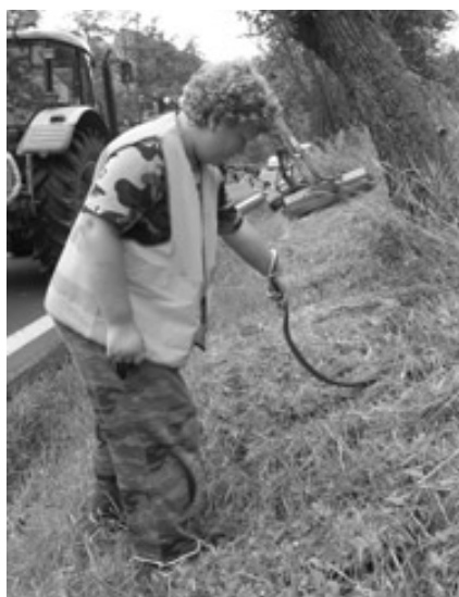
Dobrovolník vypouští zachráněnou užovku stromovou v místě, kde ji před vyžínáním silničního příkopu odchytil. Na snímku vpravo odchytil užovku před zásahem těžké techniky