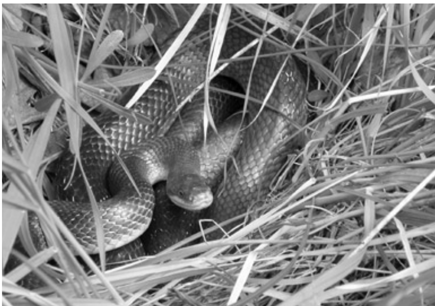
Dospělá užovka stromová

V minulém a předminulém vydání Zooreportu jsme informovali o užovce stromové v Bílých Karpatech a v Podyjí. Nyní přinášíme závěrečnou část našeho seriálu, která se týká třetí oblasti výskytu v České republice – Pooohří. Tamní populace se od dvou předcházejících liší v mnoha ohledech. Především tím,