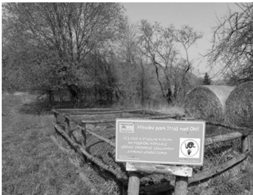
Oplacené líhniště užovek stromových s nabídkou různých substrátů

Užovka stromová preferuje pestrou strukturu krajiny se širokou nabídkou rozmanitých biotopů. Nejvíce se tedy užovky v Poohří dotkly hospodářské změny po roce 1948, které vedly ke změně krajinné mozaiky. Naštěstí s rozvojem chatařství vznikla v krajině mozaika jiná a užovka ji přijala. Po roce 1989 se však situace dále mění. V bezlesí, které slouží zemědělské výrobě, se hospodaří příliš intenzivně, a naopak plochy neobhospodařované zarůstají stále více. Ve většině volné krajiny tak vznikají dva extrémní biotopy, které pro sledovaný druh nejsou vhodné: buď intenzivně obhospodařované krajinné celky, nebo zcela zanedbaná, kdysi obhospodařovaná krajina. Užovka stromová tak v Poohří přežívá pouze v obcích a chatařských osadách. Obývá tam především násypy silnic a železnic, zidky skládané